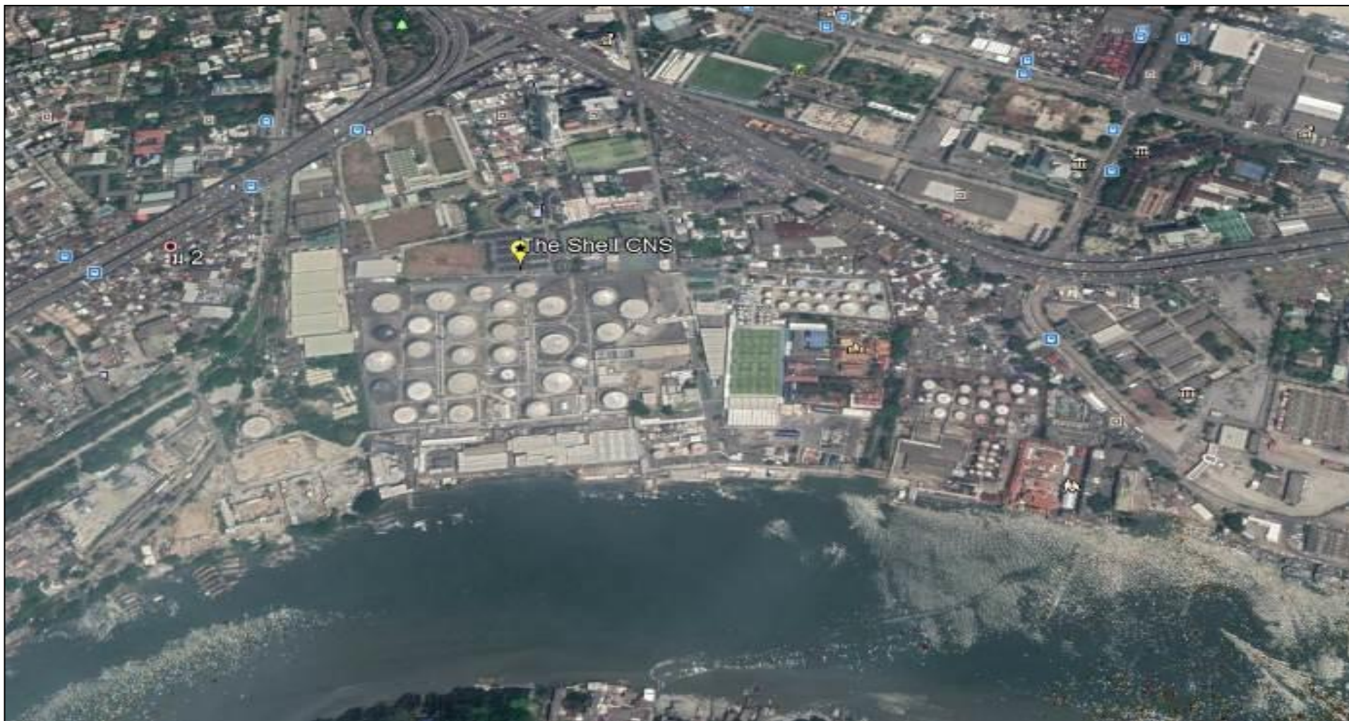
รูปที่ 1.4.2-1 แผนผังแสดงตำแหน่งท่าเทียบเรือและคลังน้ำมันเชลล์ช่องนนทรี